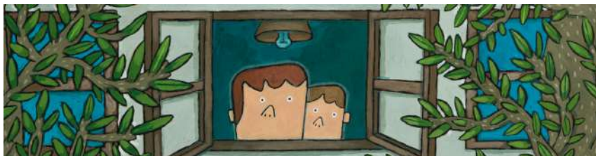
Ilustración de Óscar Villán

Los fragmentos literarios seleccionados abarcan diez obras de Miguel Delibes, escritas entre 1947 y 1989, y nos presentan a quince niños y niñas de todas las edades, orígenes, clases sociales y caracteres.