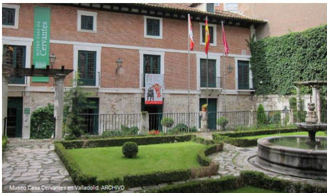
Museo Casa Cervantes en Valladolid.

11.03.2019 CULTURA VALLADOLID | TRIBUNA DE VALLADOLID | @TRIBUNAVA