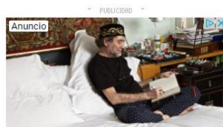
Últimos Ejemplares - Garagatos