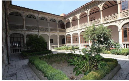
Uno de los patios del convento de Santa Catalina.