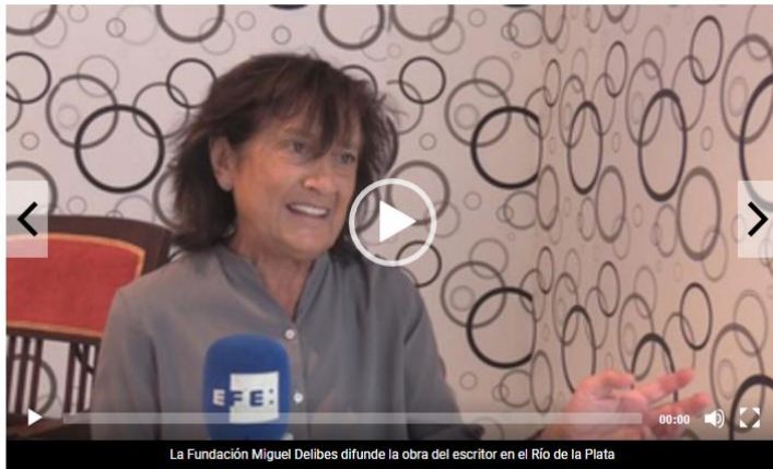
La Fundación Miguel Delibes difunde la obra del escritor en el Río de la Plata