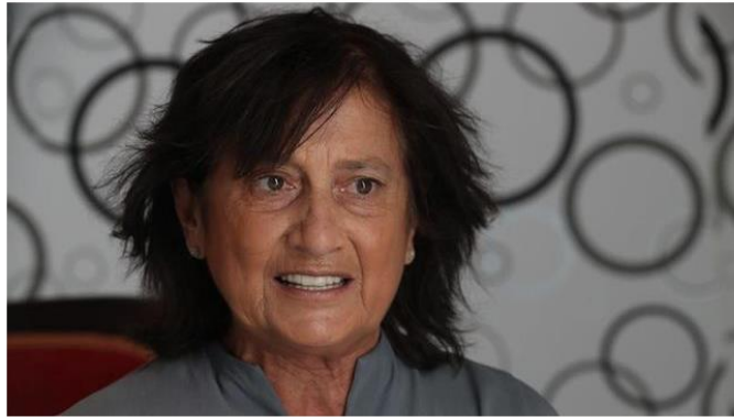
La Fundación Miguel Delibes difunde la obra del escritor en el Río de la Plata

La Fundación Miguel Delibes difundirá durante el mes de noviembre la obra del escritor y periodista español en Argentina y Uruguay mediante diversas jornadas que tratarán la figura del intelectual.