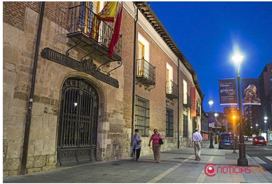
Los viandantes caminan cerca del Palacio de Pimentel

Compartir en Facebook Compartir en Twitter Me gusta 130 Tweet