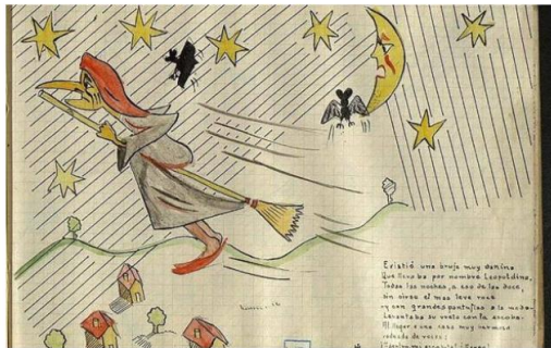
Una página de 'La bruja Leopoldina'.

La editorial Destino recupera 'La bruja Leopoldina', un cuento ilustrado que el autor de 'Cinco horas con Mario' escribió con 18 años