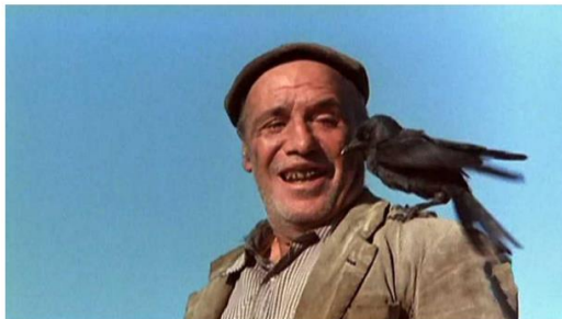
Paco Rabal y su milana bonita en Los santos inocentes