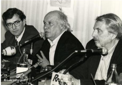
Paco Rabal junto a Alain Tanner y Gerardo Herrero en la SEMINCI.