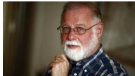
Alberto Manguel, premio Formentor de las Letras 2017