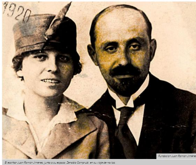
El escritor Juan Ramón Jiménez, junto a su esposa, Zenobia Camarón, en su viaje de novios.