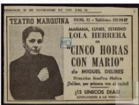
Cover de la presentación de la obra

También se podrán observar ejemplares de un gran número de ediciones de Cinco horas con Mario de diferentes años, colecciones y formatos, y publicadas por distintos sellos editoriales. Se contarán además de con reseñas críticas, referidas a la novela en el momento de su aparición, tanto en prensa nacional e internacional, como en revistas culturales.