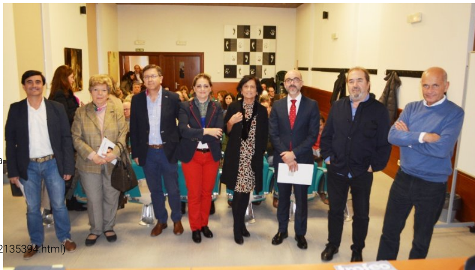
Diputación de Toledo destaca el legado literario cultural y humano de Miguel Delibes

(/articulo/toledo/muestra-teatro-local-talavera-reina-contara-13-grupos/20161108164052135394.html)