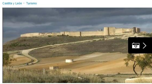
Panorámica de la Villa de Uruña.