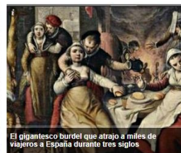
El gigantesco burdel que atrajo a miles de viajeros a España durante tres siglos